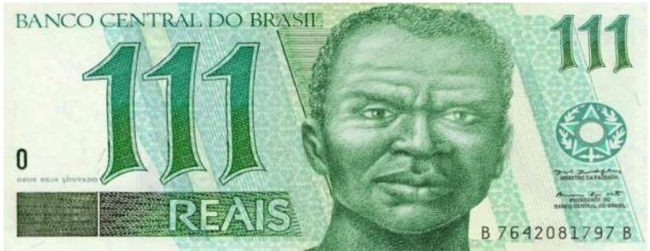
IMAGEM 1 – 111 REAIS SEM FURO 3