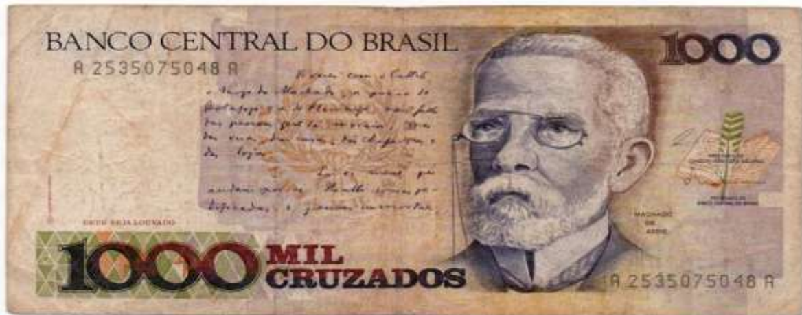
IMAGEM 3 – 1000 CRUZADOS ANVERSO 5

Fonte: Numismata. Disponível em: https://pt.numista.com/204093 . Acesso em: 16 jul. 2025.